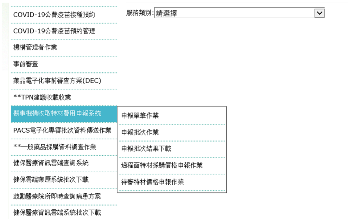
圖 3.健保資訊網服務系統（VPN）我的首頁