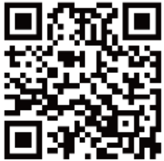
「全民健保行動快易通」 IOS 及 Android 通用版下載